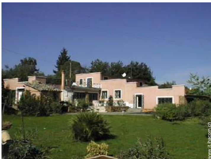
Villa di Charme