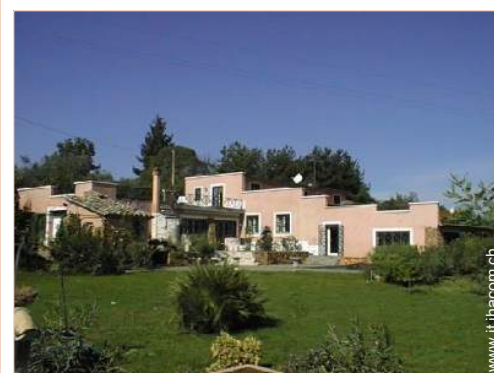
Villa di Charme