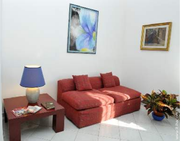
Comfort interno ed attrezzature