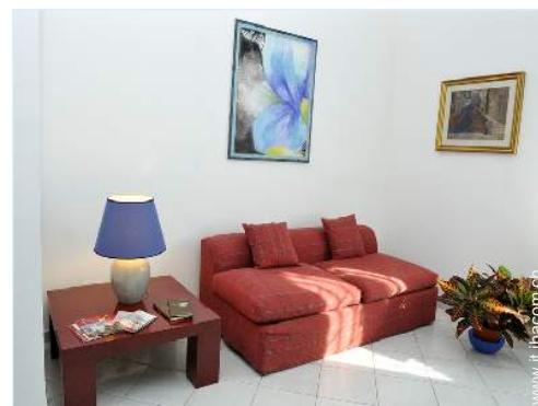
Comfort interno ed attrezzature