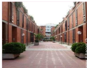
vista sul cortile