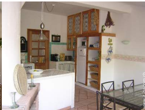
grande cucina indipendente