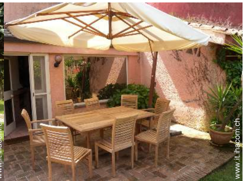
tavolo da giardino