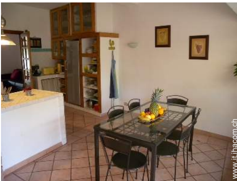
grande cucina indipendente