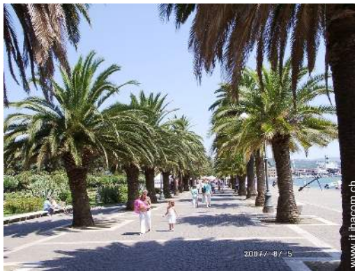
parco e giardino