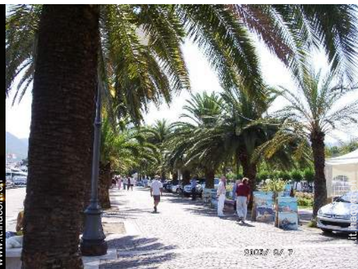
parco e giardino