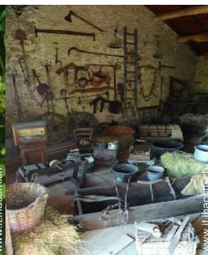
antichità &#38; anticaglie