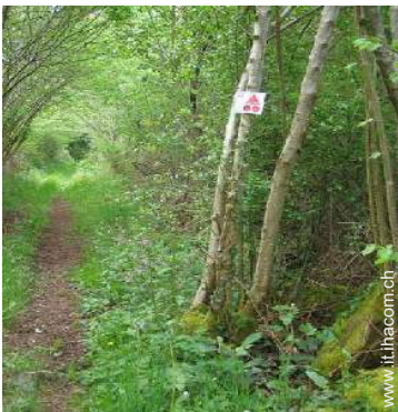
percorso per mountain bike