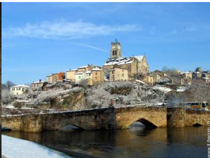
vista sulla città