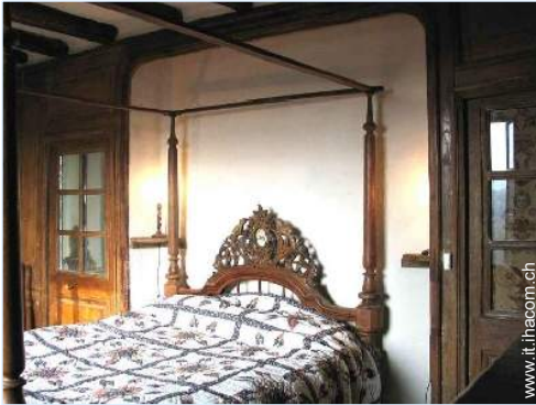
letto(i) matrimoniale(i) a baldacchino