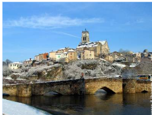
vista sulla città