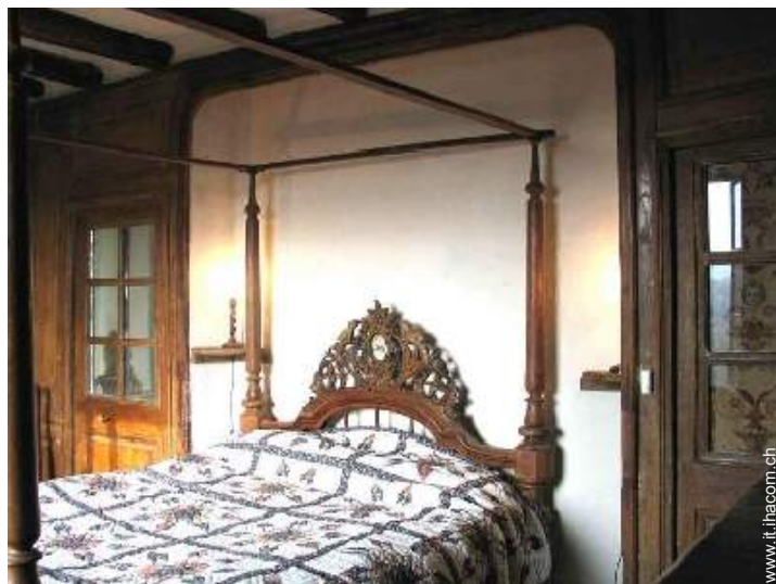
letto(i) matrimoniale(i) a baldacchino