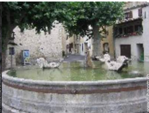
vista sul centro del paese