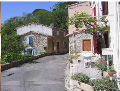
Cottage di Charmes