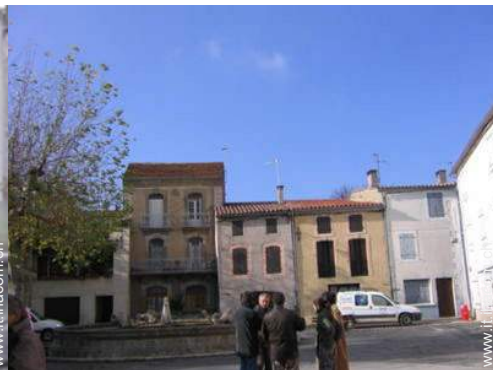
vista sul centro del paese