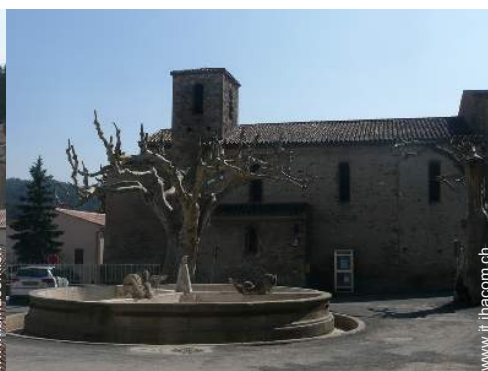
vista sul centro del paese