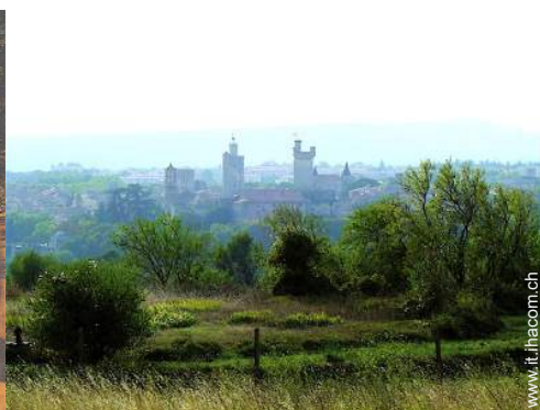
vista sulla città