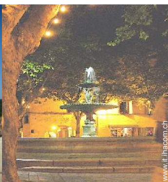
vista sulla piazza