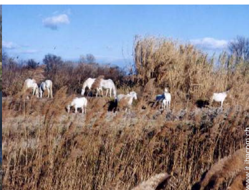
passaggiata a cavallo