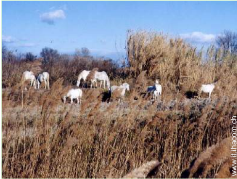
passeggiata a cavallo