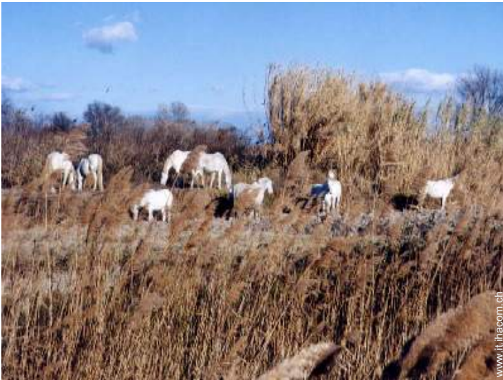
passeggiata a cavallo