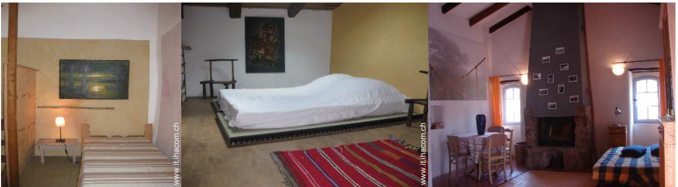
futon 2 pers