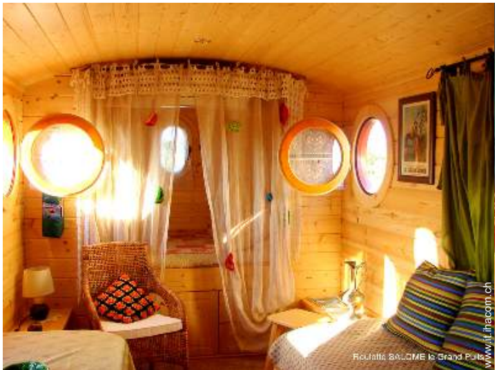
Roulotte di Charme