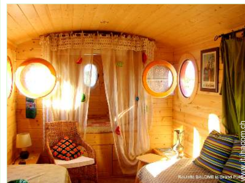
Roulotte di Charme