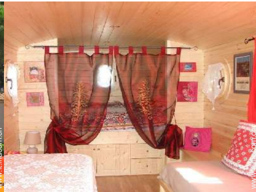
Roulotte di Charme