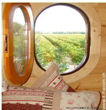
vista sui vigneti