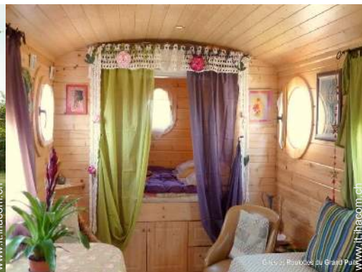
Roulotte di Charme