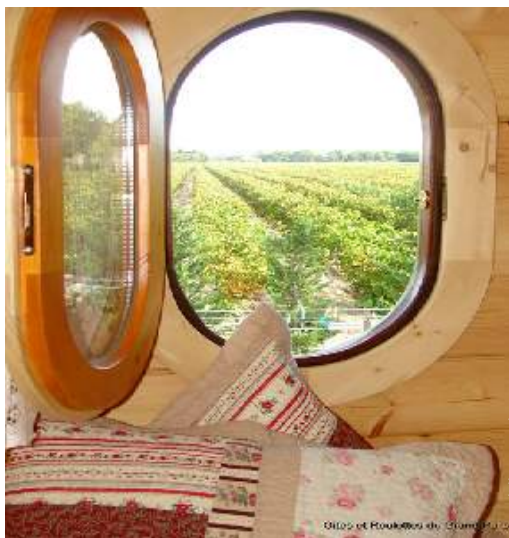
vista sui vigneti