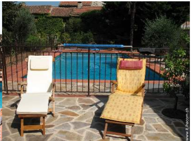
Attrezzature esterne a disposizione degli ospiti