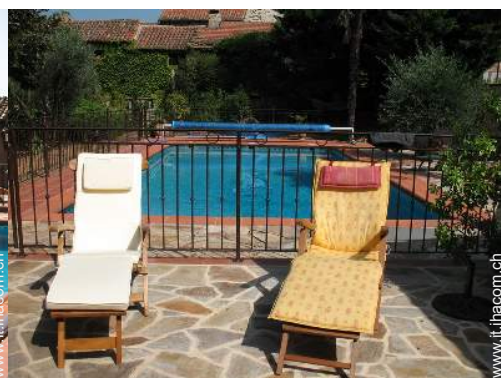
Attrezzature esterne a disposizione degli ospiti