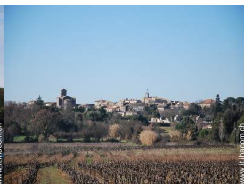
vista sul villaggio