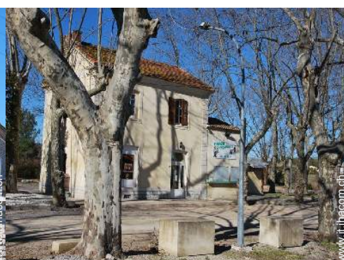
vista sul villaggio