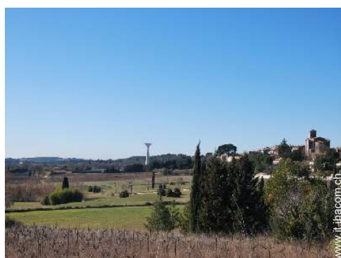
vista sul villaggio