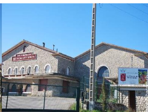
vista sul villaggio