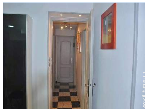
Disposizione interna e confort

Barbecue, tavolo da giardino, 8 sedia(e) da giardino, pergolato, 4 chaise(s) longue(s), 4 sedia sdraio