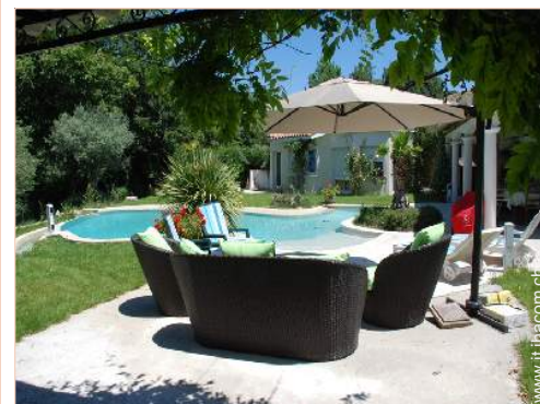
salotto da giardino