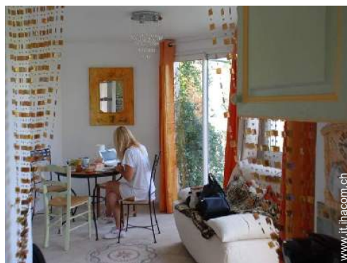
Comfort interno ed attrezzature