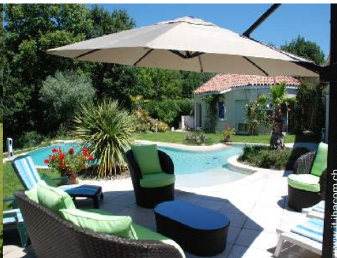
salotto da giardino