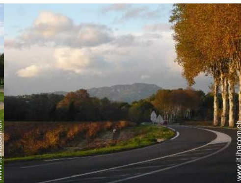
Attrazioni e relax