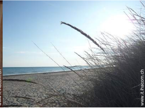
attività balneari nelle vicinanze