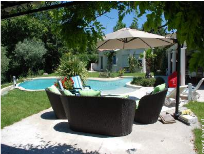
salotto da giardino