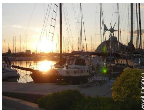
sport acquatici nelle vicinanze