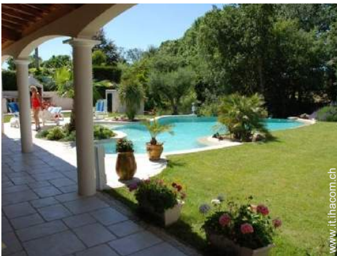
Piscina a sfioro