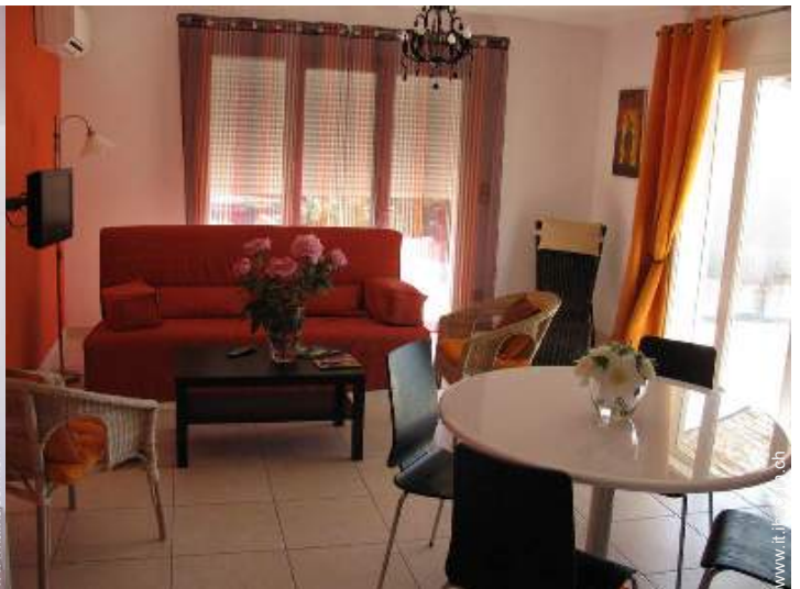
Comfort interno a disposizione degli ospiti