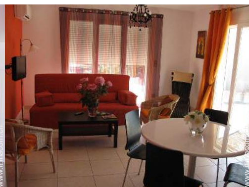
Comfort interno a disposizione degli ospiti