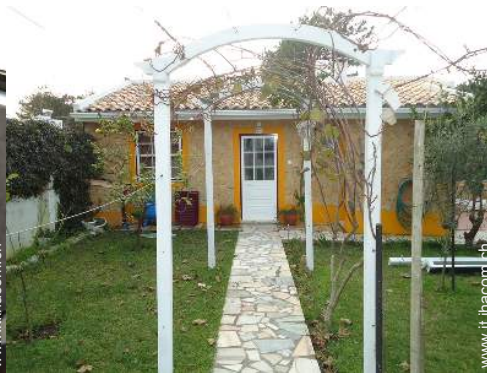
tettoia di giardino