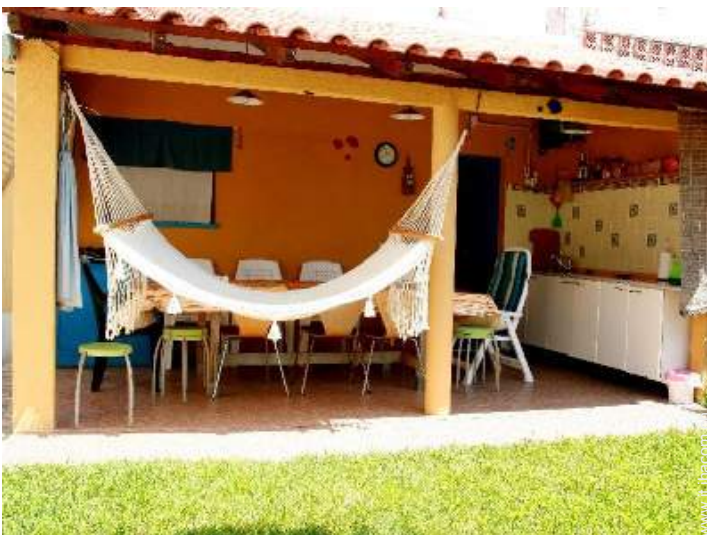
tavolo da giardino