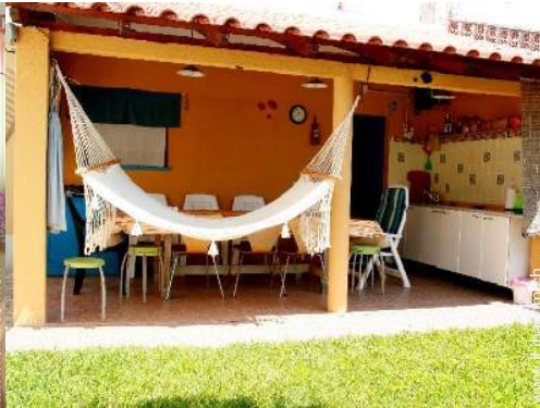
tavolo da giardino