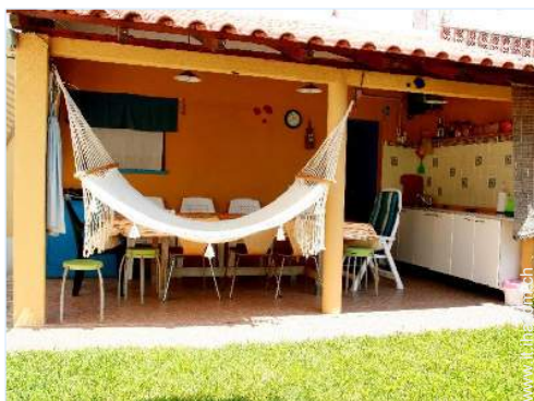
tavolo da giardino