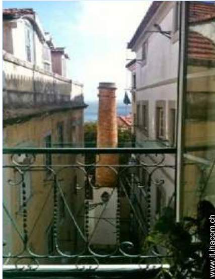
vista sul fiume