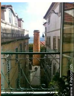
vista sul fiume