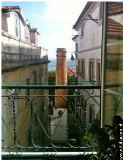
vista sul fiume