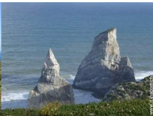
spiaggia dei nudisti