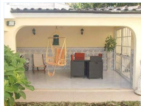
tettoia di giardino