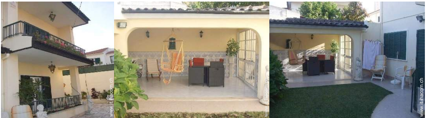
tettoia di giardino