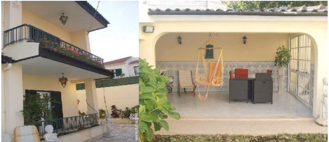
tettoia di giardino