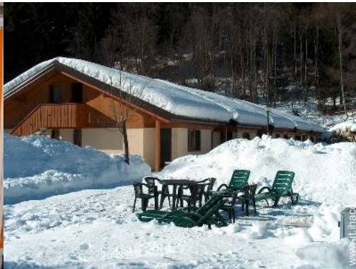
sedia(e) da giardino