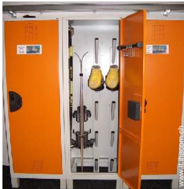
armadio per gli sci