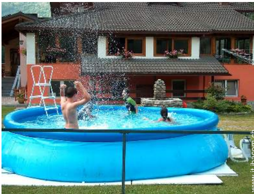
piscina per bambini