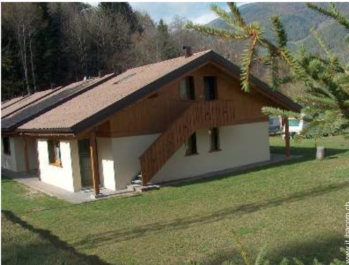
Chalet di Montagna