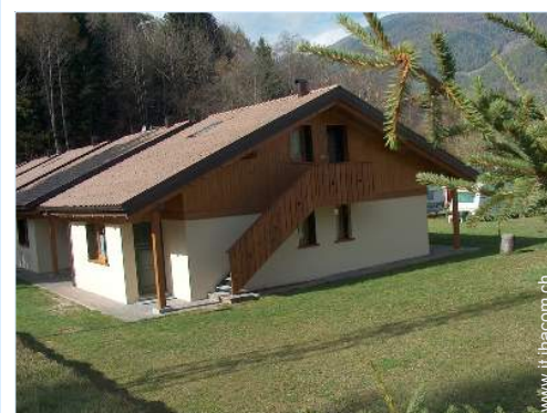
Chalet di Montagna