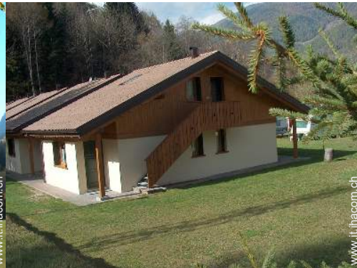
Chalet di Montagna