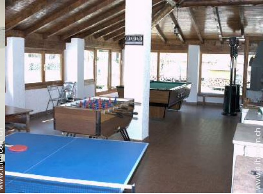
tavolo da ping-pong