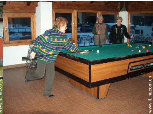
tavolo da biliardo