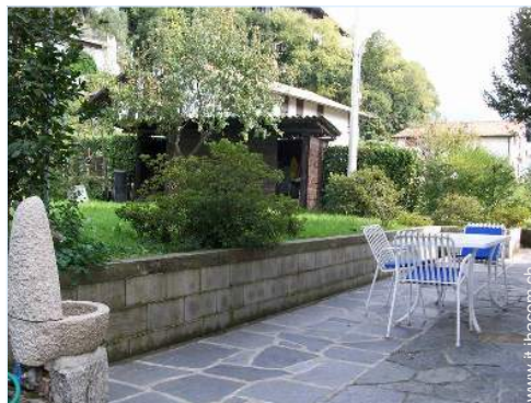
tavolo da giardino