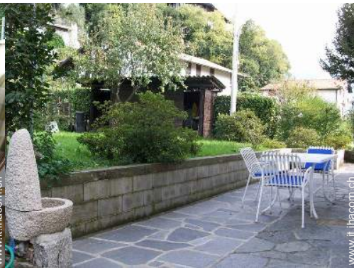
tavolo da giardino