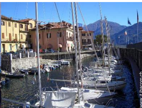
scalo di alaggio per la barca