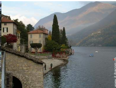
spiaggia con ciotoli