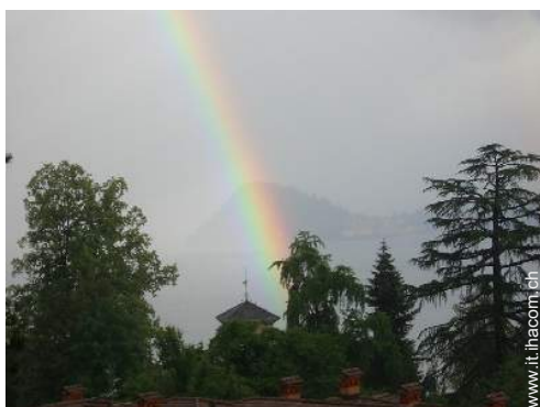
vista sul lago