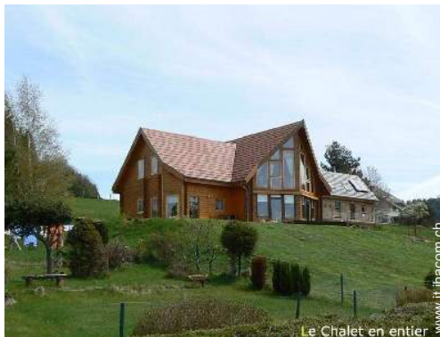
Le Chalet en entier