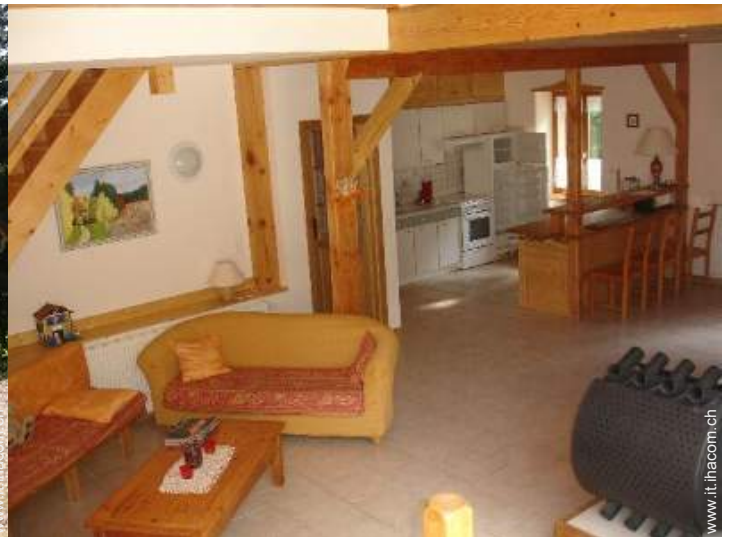
grande cucina in stile americano