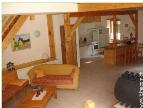
grande cucina in stile americano