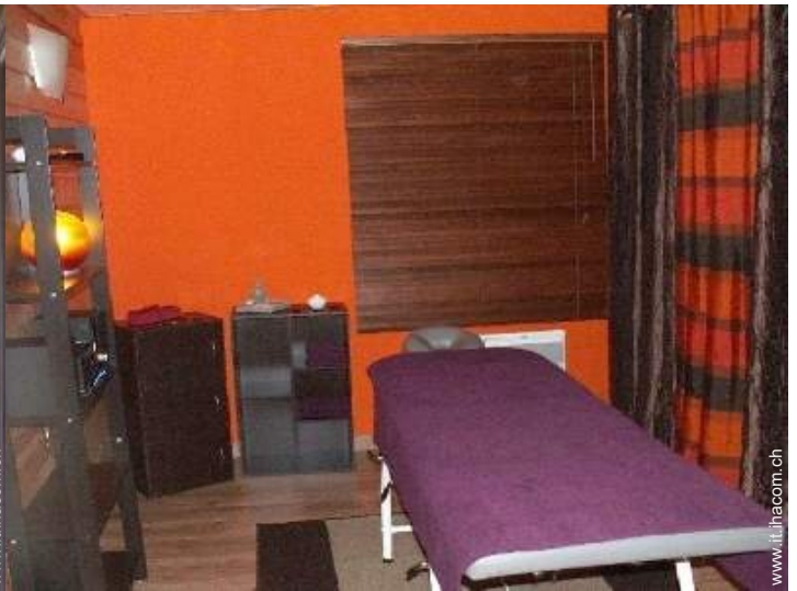
lettino da massaggio