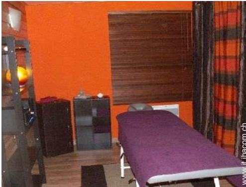
lettino da massaggio