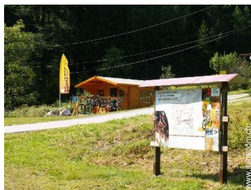
attività montane nelle vicinanze