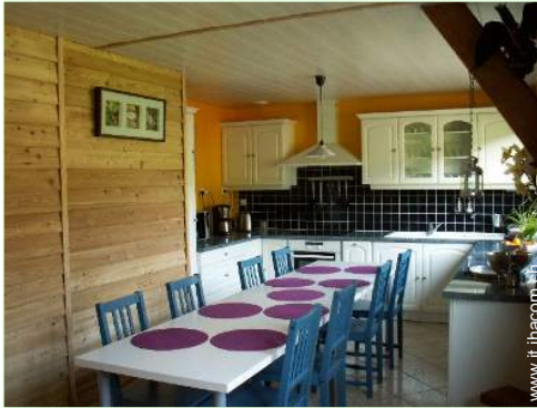
grande cucina in stile americano