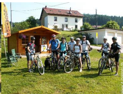
percorso per mountain bike