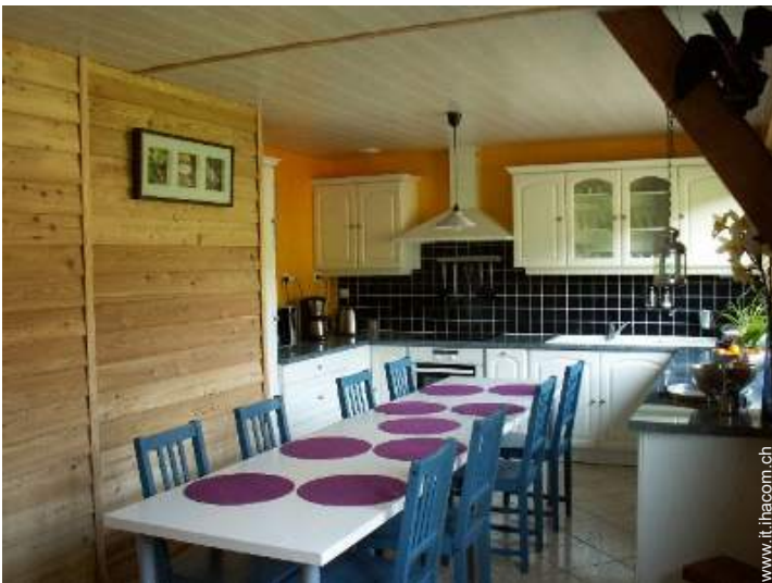
grande cucina in stile americano