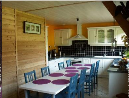
grande cucina in stile americano