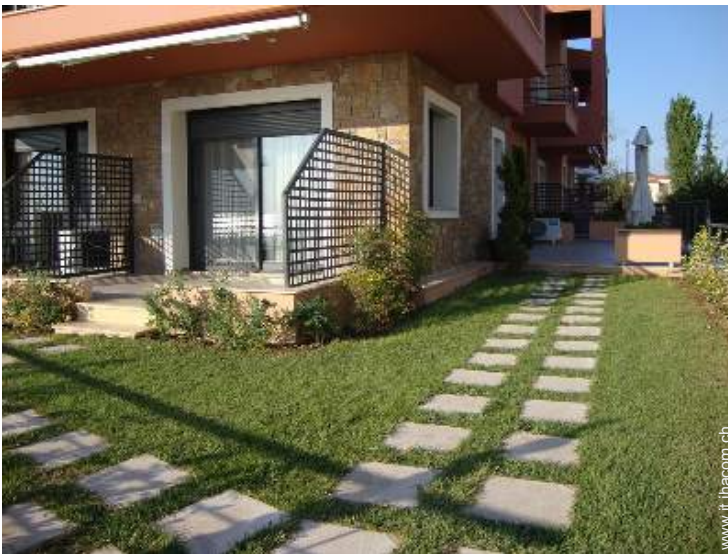
Studio di Charme