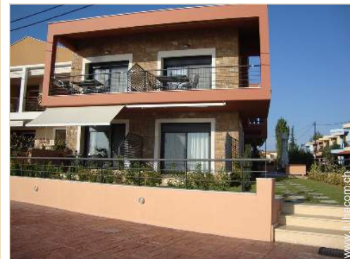
Studio di Charme