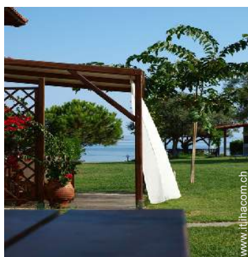
Residenza di Charme