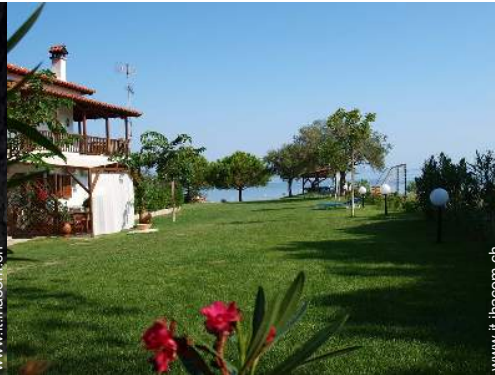
Residenza di Charme