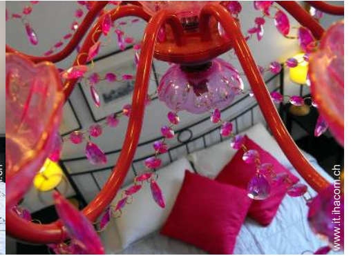
Residenza di Charme