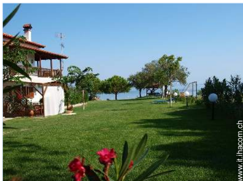
Residenza di Charme