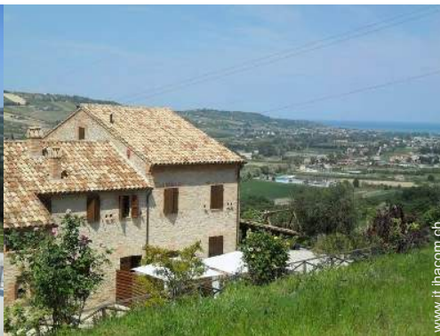
Villa di Prestigio