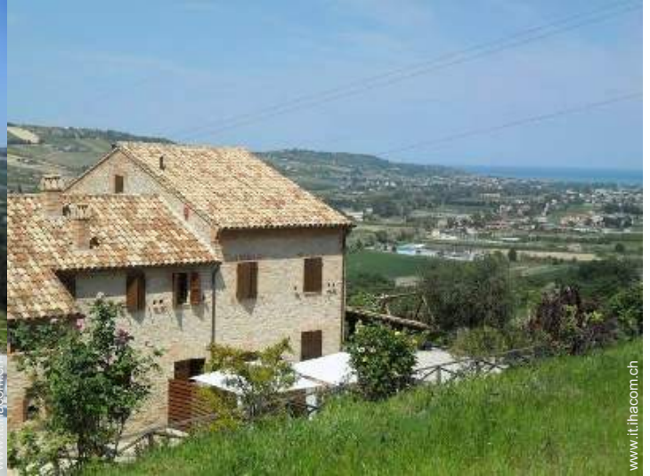
Villa di Prestigio