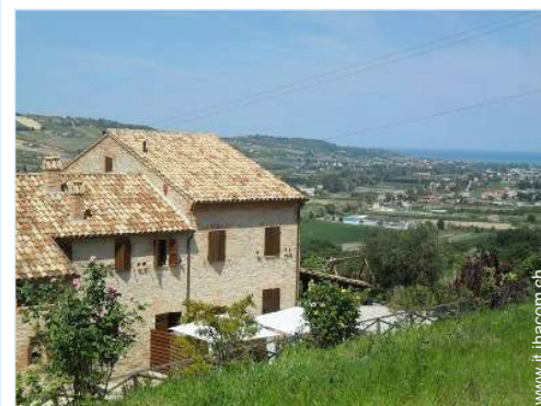
Villa di Prestigio