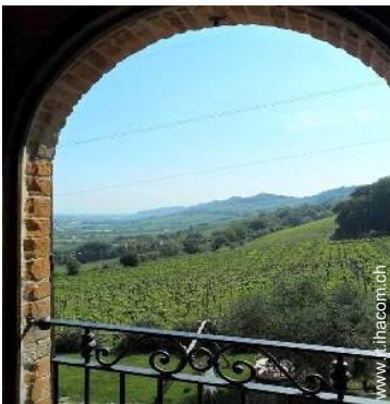
vista sui vigneti