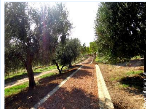
parco e giardino