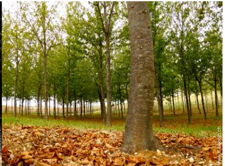
parco e giardino