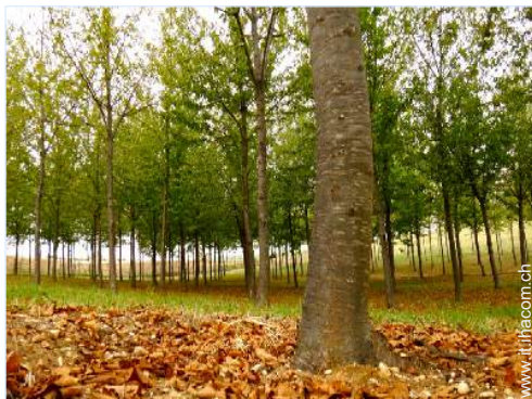
parco e giardino