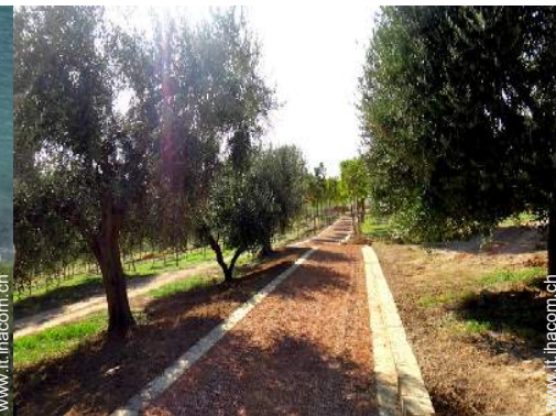
parco e giardino