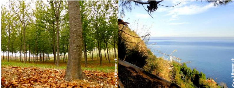
parco e giardino