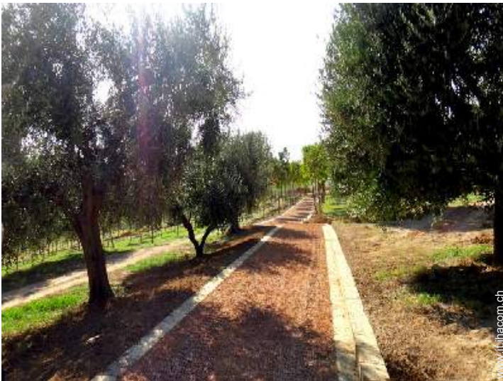
parco e giardino