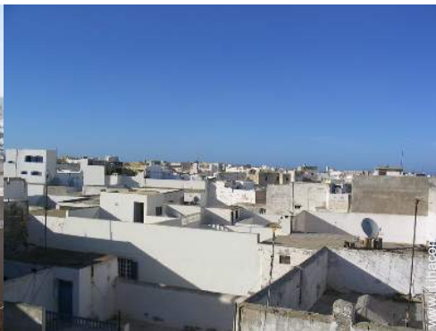
vista sui tetti