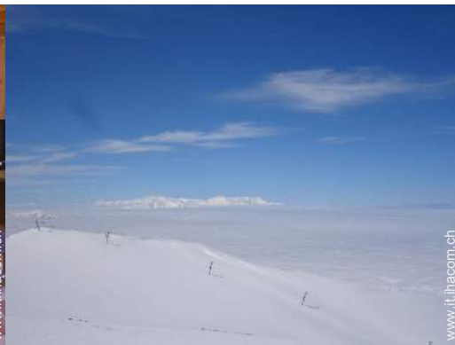
piste di sci