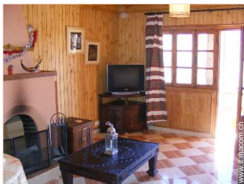
Chalet di Montagna Prestigio