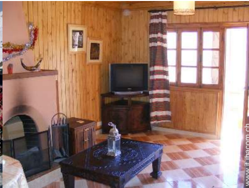
Chalet di Montagna Prestigio