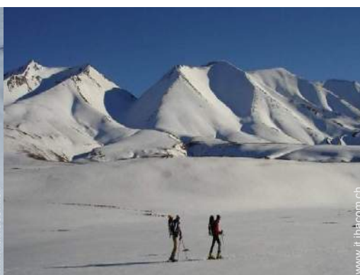
sci di fondo