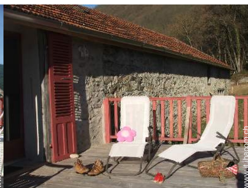
Casa in Pietra di Charme