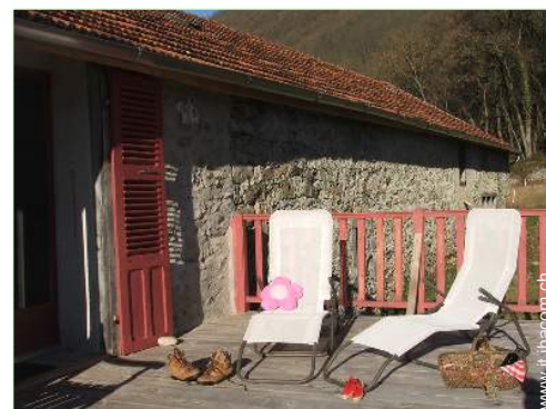
Casa in Pietra di Charme