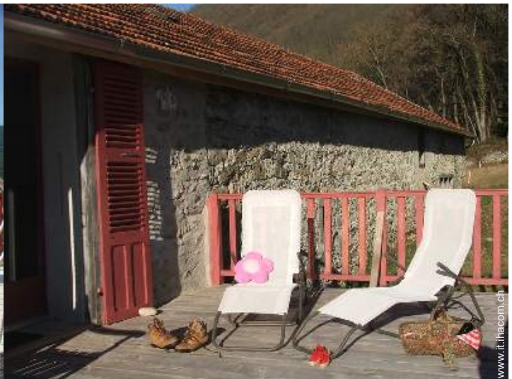
Casa in Pietra di Charme