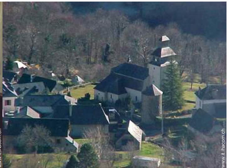
vista sul centro del paese