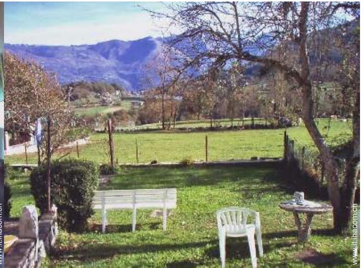
vista sul lago