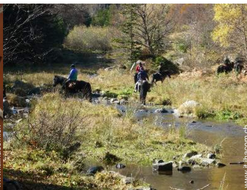
passaggiata a cavallo