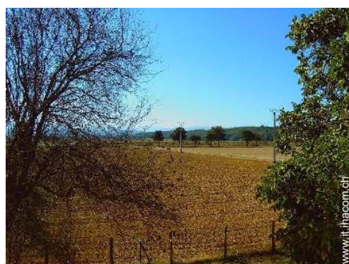
vista sui campi agricoli