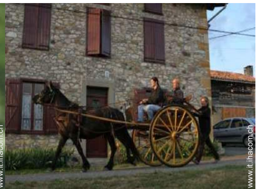
passeggiata a cavallo