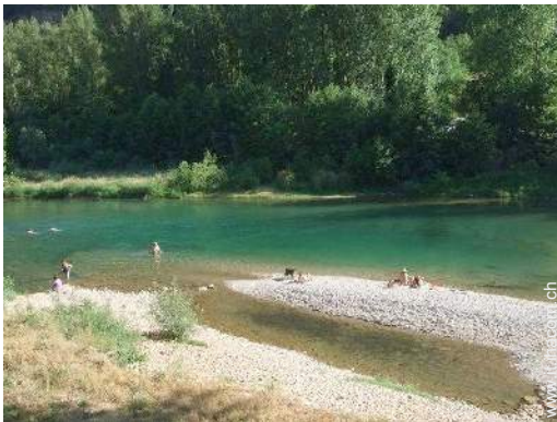
vista sul fiume