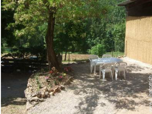
salotto da giardino