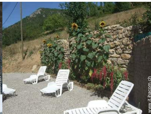
Installazione esterna a disposizione degli ospiti