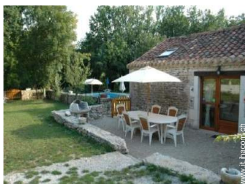
Casa in Pietra di Charme