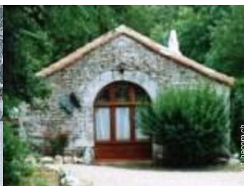
Proprietà di Charme