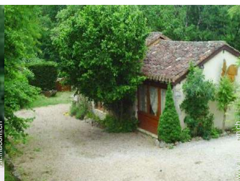
Casa in Pietra di Charme