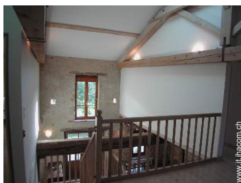
vista dal mezzanino