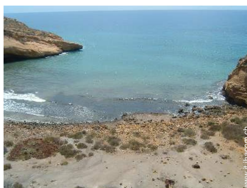
spiaggia dei nudisti