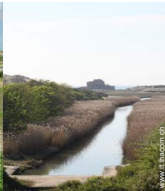
vista sul fiume