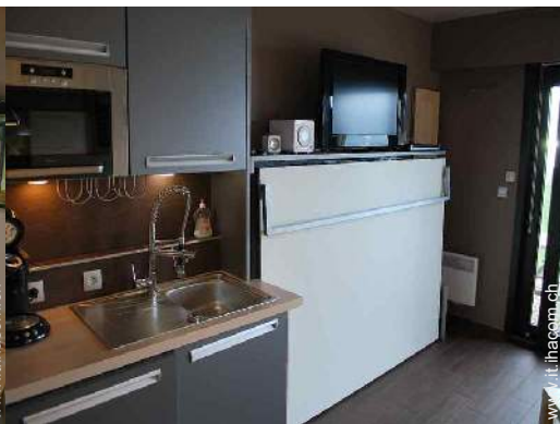
letto(i) a scomparsa 2 pers