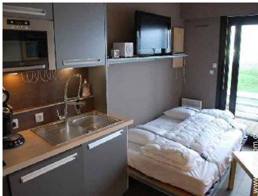
letto(i) a scomparsa 2 pers