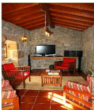
sala di musica