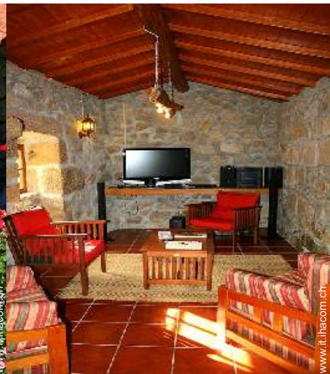
sala di musica