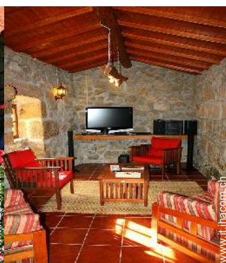
sala di musica