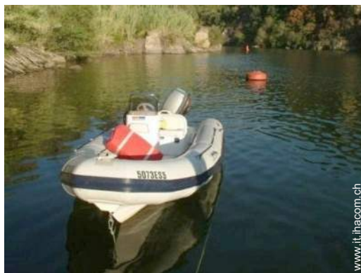
barca a motore