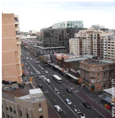
vista sulla strada/viale