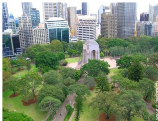
vista sul centro città